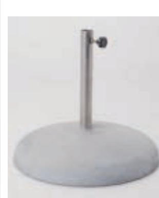
Betonsockel FP 320 CHF 192.-