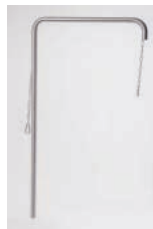
Galgen FP 300 CHF 260.-