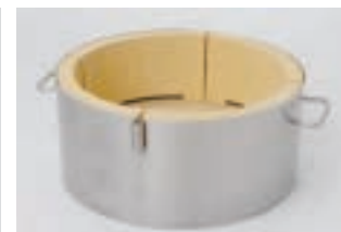
Feuertopf | ø 440 mm FP 100 CHF 557.-