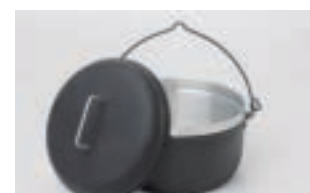
Kochkessel | 4 Liter FP 500 CHF 75.-