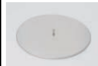
Deckel zu Feuertopf FP 140 CHF 96.-