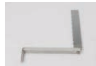
Schwenkarm FP 220 CHF 157.-