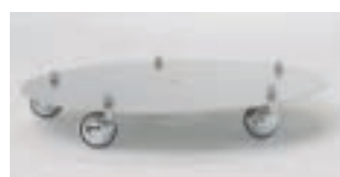
Transportroller FP 130 CHF 190.-