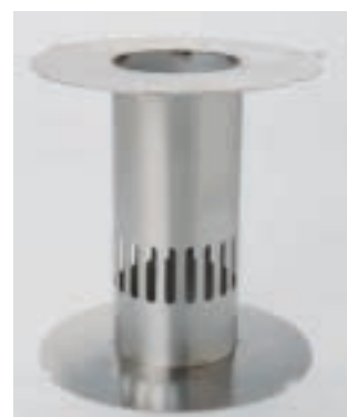
Sockel | Höhe 480 mm FP 121 CHF 252.-