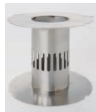
Sockel | Höhe 360 mm FP 120 CHF 222.-