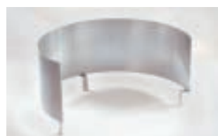
Windschutzblech FP 700 CHF 101.-