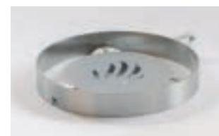
Fondue-Einsatz FP 215 CHF 180.-