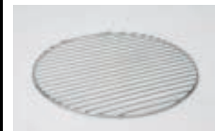
Rost FP 210 CHF 156.-