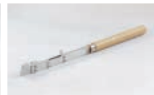
Halter mit Holzgriff FP 205 CHF 100.-