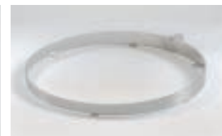
Grillrost-Einsatz FP 208 CHF 120.-